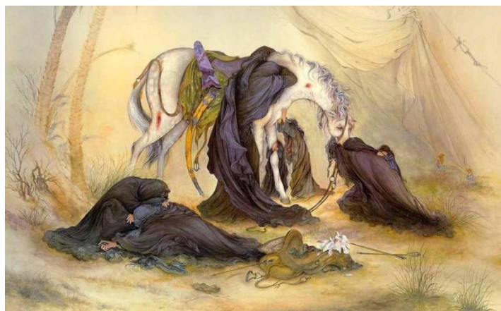
شکل ۱: تابلو عصر عاشورا، اثر محمود فرشچیان، موزه آستان قدس رضوی

بازنمایی او از فضای کربلا) را مشخص می‌کند. بدین روی می‌توان دید که فضای کربلا به چه صورتی نزد وی ظاهر شده است و انتخاب قطب‌های دوگانه، در توصیف فضای کربلا آشکار می‌گردد.