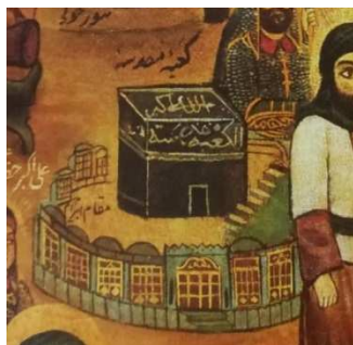
کعبه و مقام ابراهیم، بخشی از پرده مصیبت کربلا