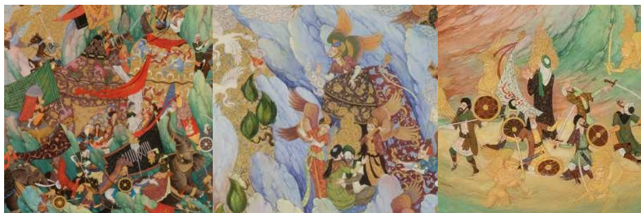
بخش‌هایی از تصویر پرده عاشورای حبیبی