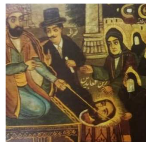
بارگاه یزید و خاندان سیدالشهدا که به اسارت گرفته شده‌اند / بخشی از تصویر.