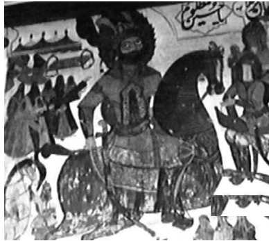
تصویر ۴. رفتن قمر بنی‌هاشم علمدار کربلا حضرت ابوالفضل‌العباس علیه السلام به سمت شریعه فرات برای آوردن آب. بقعه چهار پادشاه لاهیجان. عکاسی در سال ۱۳۸۵.