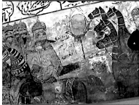
تصویر ۹. بردن سرهای شهدا و سر امام حسین علیه السلام توسط لشکر یزیدیان به شام. بقعه آقاسیدمحمد یمنی بن امام موسی الکاظم علیه السلام واقع در روستای لیچا. عکاسی در سال ۱۳۸۵.