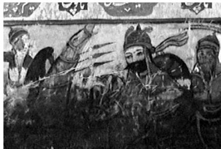
تصویر ۵. نبرد حضرت قاسم علیه السلام با ازرق شامی و پسرانش. فضای داخلی بقعه ملاپیرشمس‌الدین واقع در محله لاشیدان حکومتی لاهیجان. عکاسی در سال ۱۳۸۵.