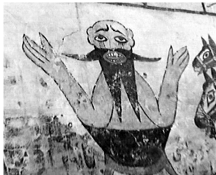
تصویر ۱۰. شکنجه عوامل واقعه کربلا و یزیدیان. بقعه آقاسیدمحمد یمنی بن امام موسی الکاظم علیه السلام واقع در روستای لیچا. عکاسی در سال ۱۳۸۵.